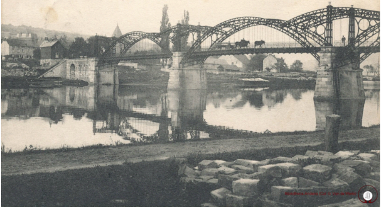
15 - Le Pont de Namèche.

Editeur Imprimerie économique O. Croyne, Namèche.