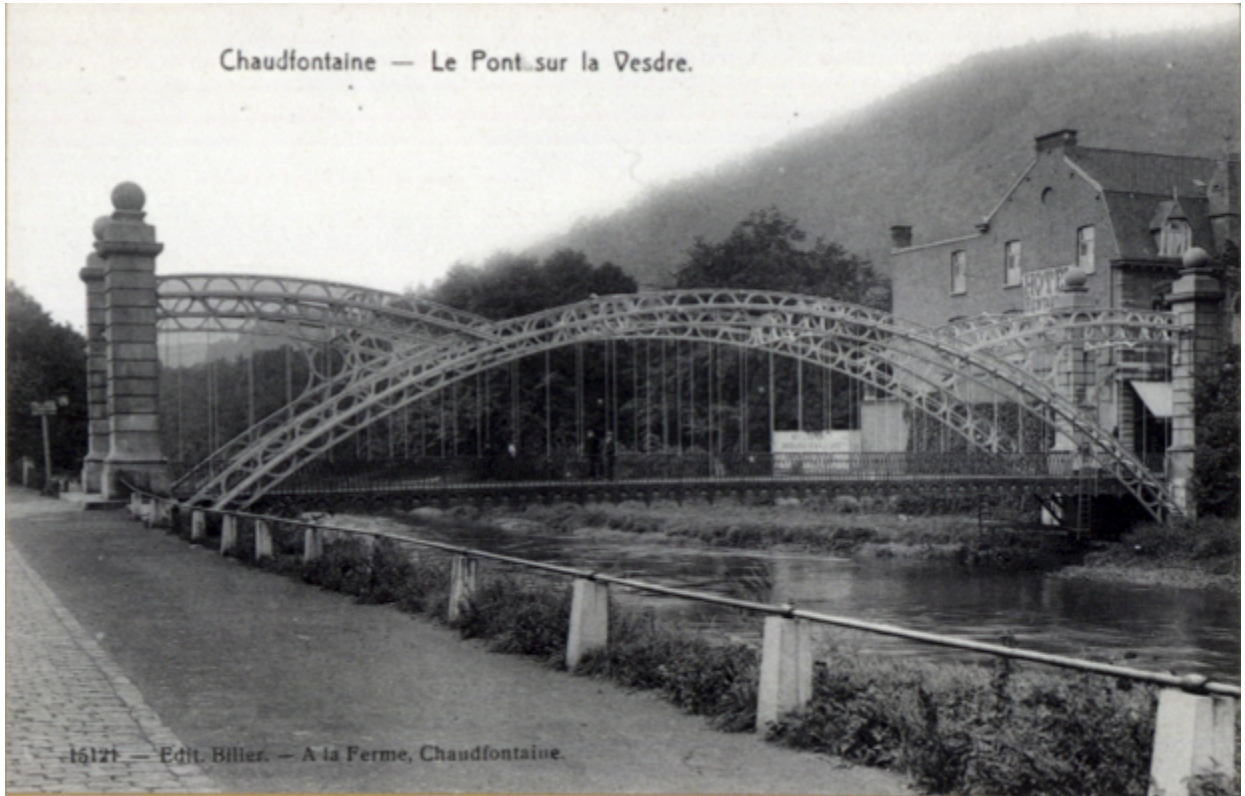
Chaudfontaine — Le Pont sur la Vesdre.

16121 — Edit. Billier. — A la Ferme, Chaudfontaine.